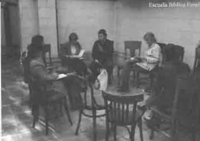
Escuela Bíblica Familiar