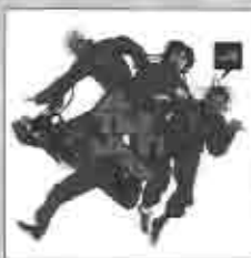
Alternativa Ya va venir 2008

La nueva producción de Alternativa se titula Ya va venir y nos presenta a una alternativa mucho más madura y asentada musicalmente sin dejar de lado la alegría y el gozo que los caracteriza desde sus inicios.