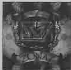
Zona 7 Libertad Revolución 2008

El cuarto proyecto de la banda ya está disponible y cuenta con la colaboración de Emmanuel Espinosa en la producción.