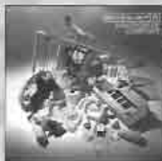
Delirious? Kingdom of Comfort 2008

www.alternativa.com.uy www.alternativa.com.uy/blog