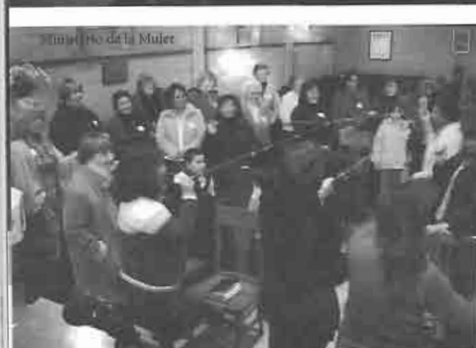
Ministerio de la Mujer