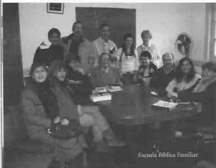
Escuela Bíblica Familiar

Más tarde se unieron 5 personas más al equipo de trabajo.