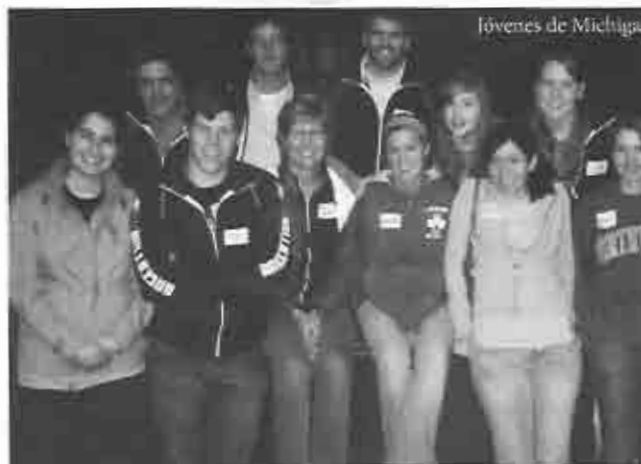
jóvenes de Michigan